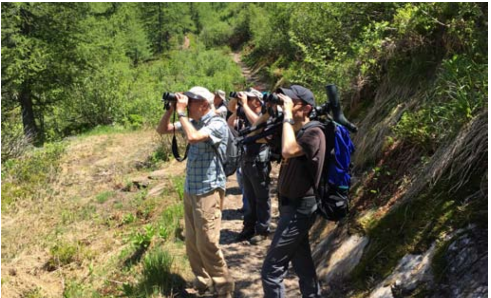
Was für ein Vogel ist denn das?

Mit einer Glanzleistung von 11 km Vogelwanderung und ein paar verbrannten Waden, war der erste Tag ein voller Erfolg. Der Abend gehörte dann schliesslich der Gemütlichkeit.