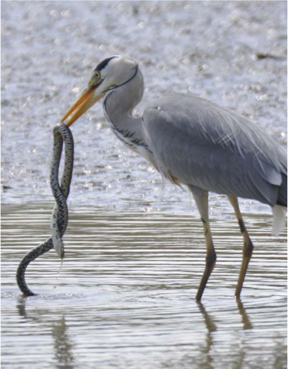
Graureiher mit Würfelnatter am Flachsee