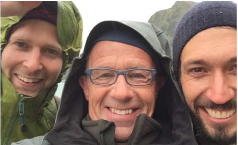
Die «Zug-Vögel» – trotz Regen hoch motiviert

Später in der Magadino-Ebene wurden wir von den Austernfischern überrascht und auch sonst waren die Limis für einmal grosszügiger auf unserer Liste vertreten. Zufrieden und