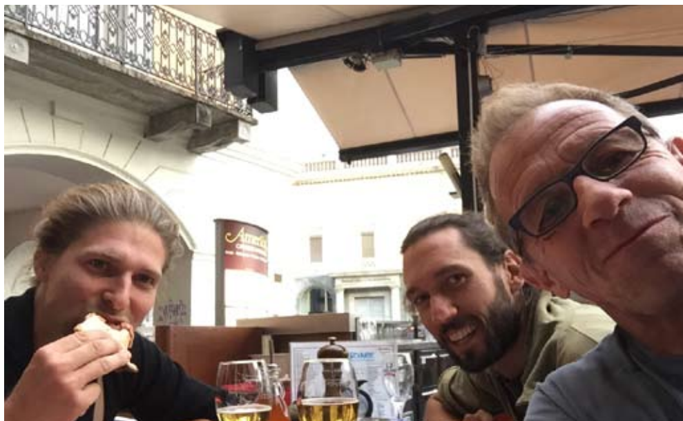
Die «Zug-Vögel» auf der Piazza Grande