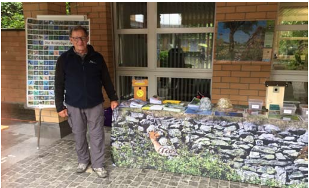
Stand an der Jubiläumsfeier auf dem Schluechthof...

Seit einigen Jahren stehen wir in regelmässigem Austausch mit dem Schluechthof. Dies wird gegenseitig geschätzt. So wird alles daran gesetzt, dass die nützlichen Schwalben oder