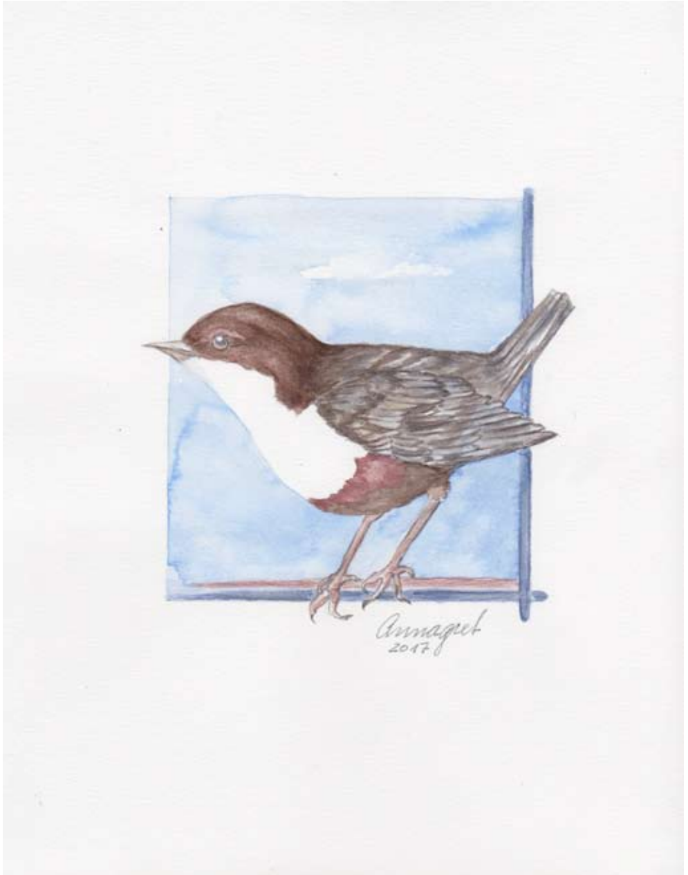
Wasseramsel, Vogel des Jahres 2017